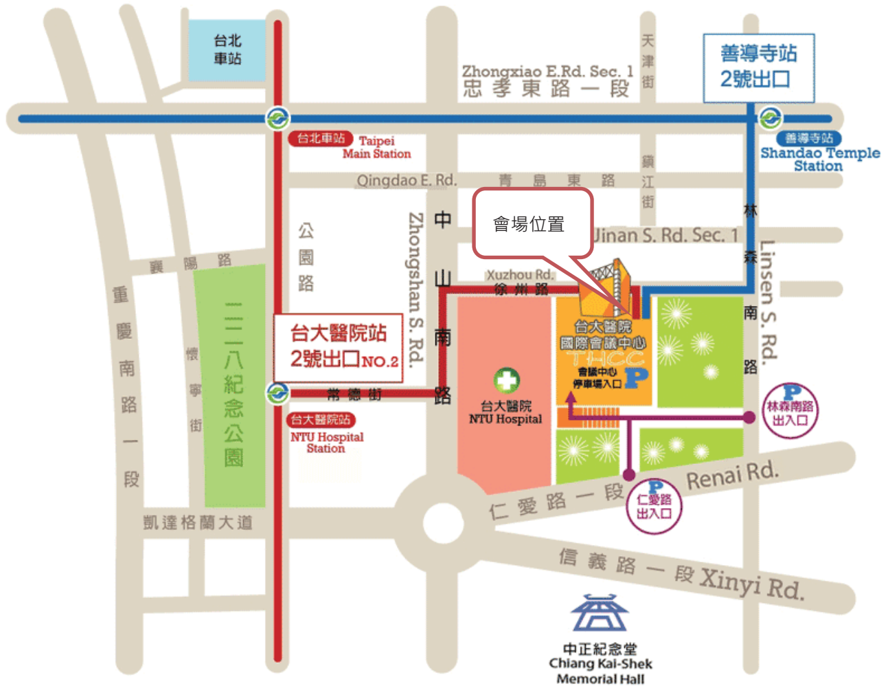
■ 台大國際會議中心位置圖